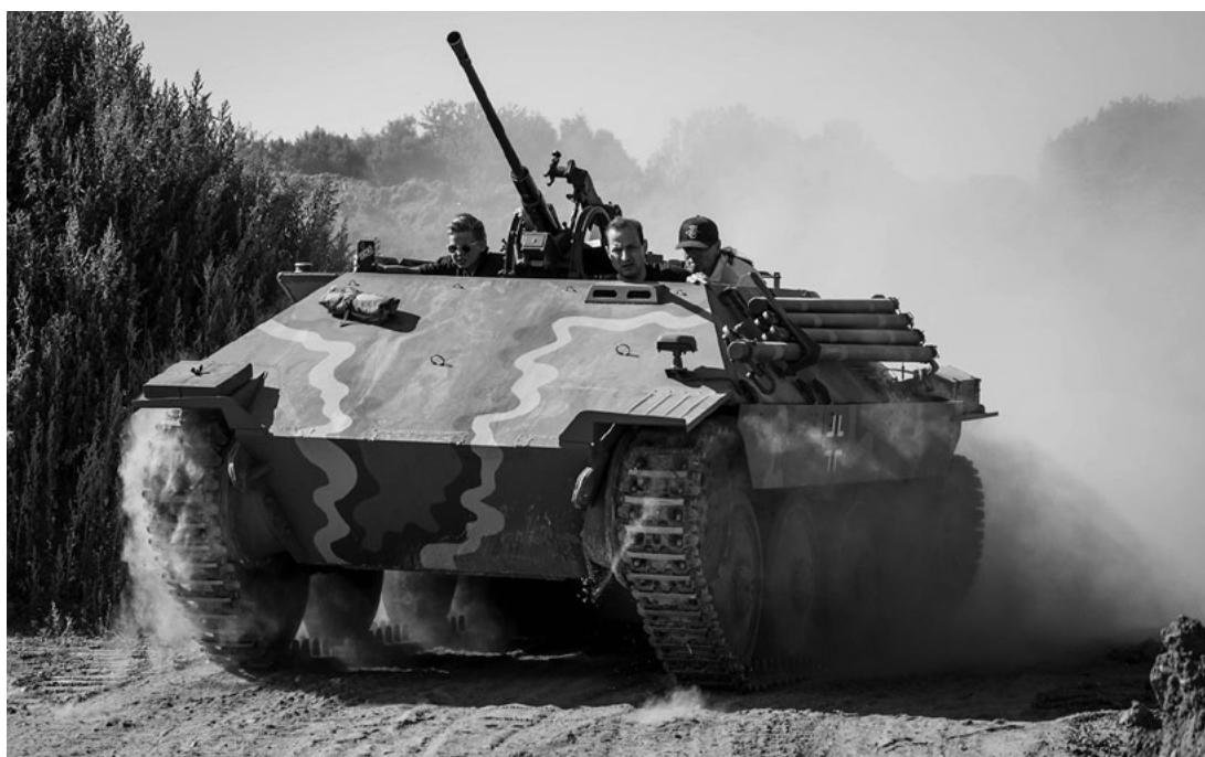
Bergepanzer 38.