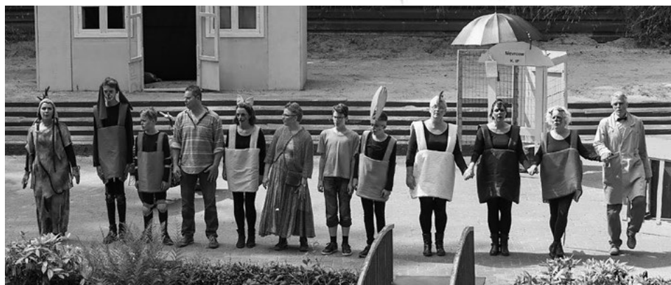
In 2016 speelde HOT de voorstelling 'Trammelant in de achtertuin' in het openluchttheater.

Speeldata: 9 & 12 juli 2023 Openluchttheater Overloon